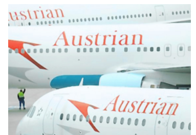
▲ Die Austrian Airlines übernehmen mehr Flüge.

gen innerhalb der sechs Drehkreuze der Gruppe konsolidiert. Ziel ist eine bessere Auslastung und stärkere Bündelung von Verkehrsströmen, während Fluggäste weiterhin Zugang zum globalen Streckennetz behalten“, erklärte die AUA. Die Airline sieht als Folge des Iran-Kriegs eine starke Nachfrage im Europaverkehr. Die Airline will ihr Sommerangebot daher gezielt darauf ausrichten.